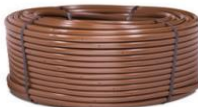
Goutteur en ligne XFD